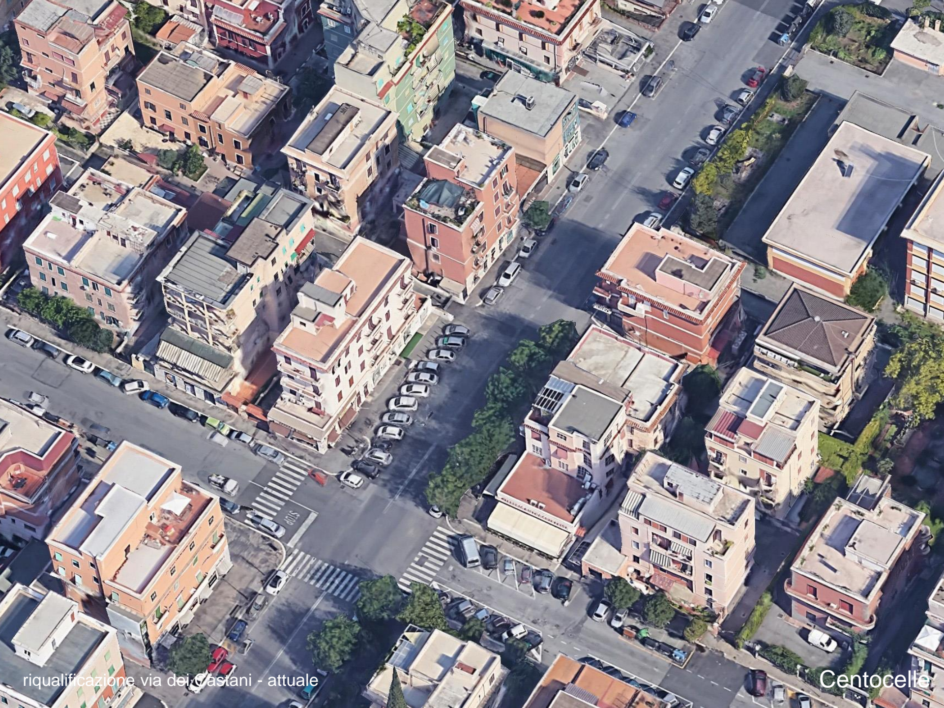
riqualificazione via dei Castani - attuale