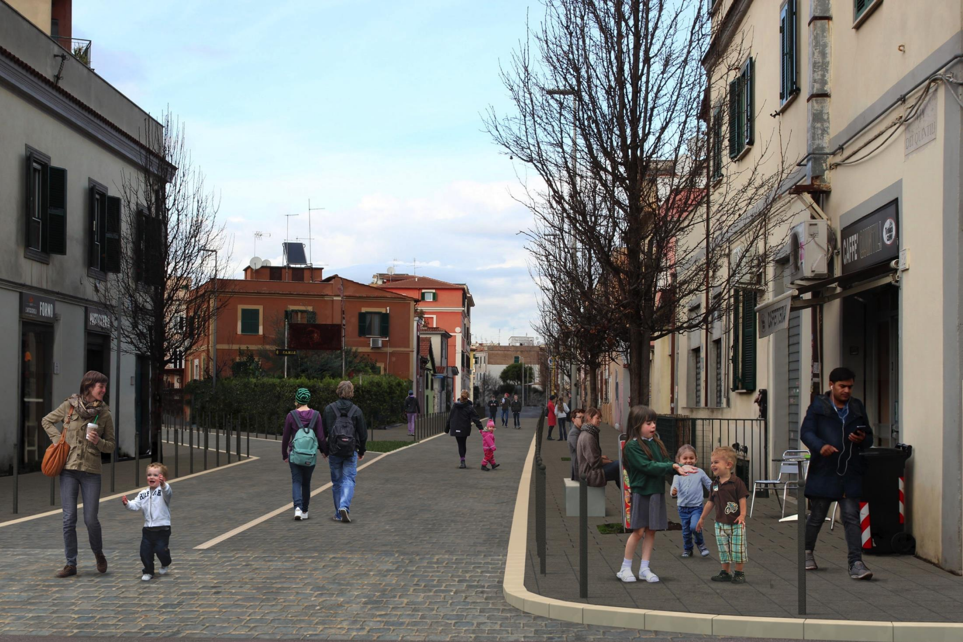
intersezione Quintili/Arvali - progetto