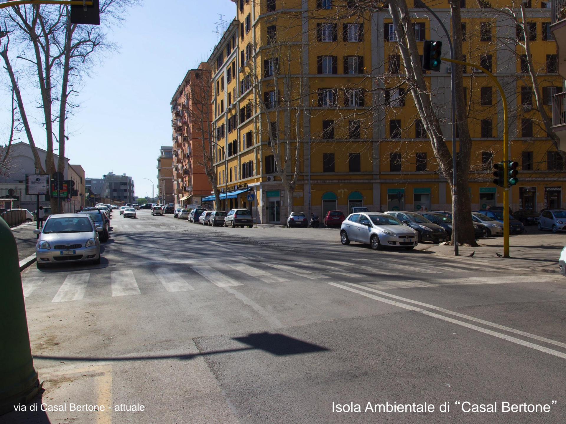
via di Casal Bertone - attuale