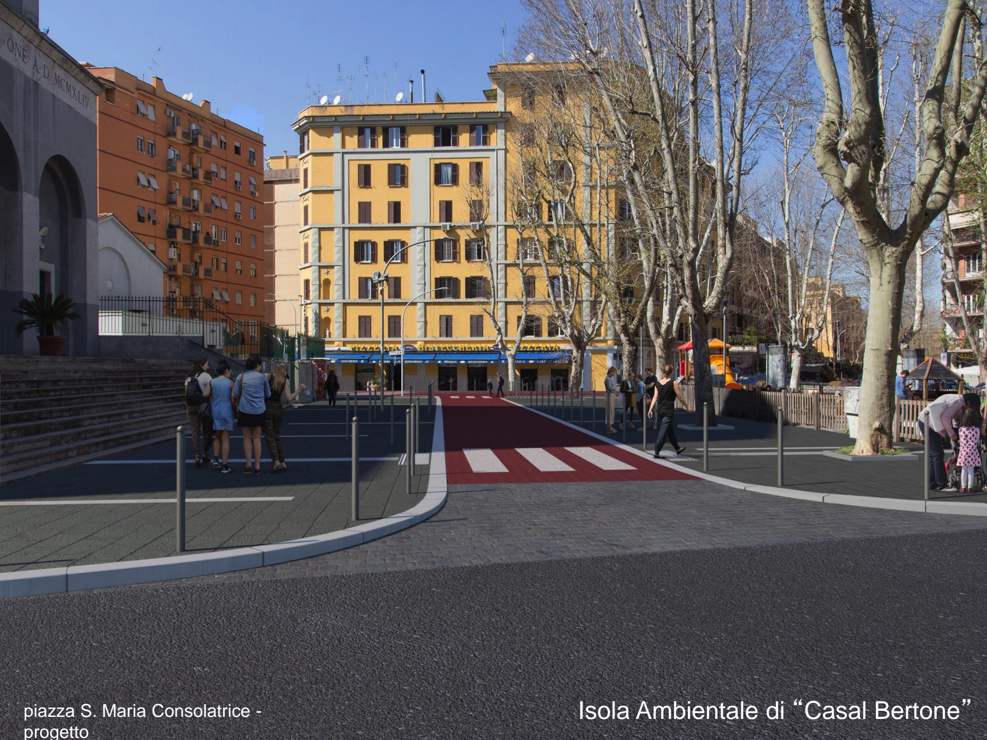
piazza S. Maria Consolatrice - progetto