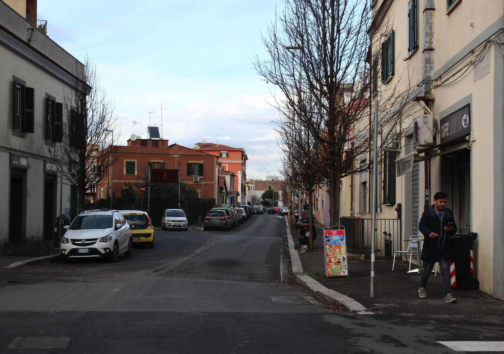
intersezione Quintili/Arvali - attuale