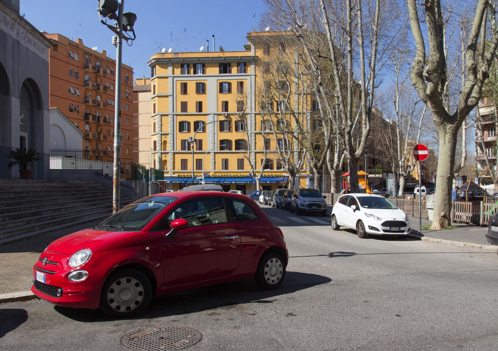
piazza S. Maria Consolatrice - attuale