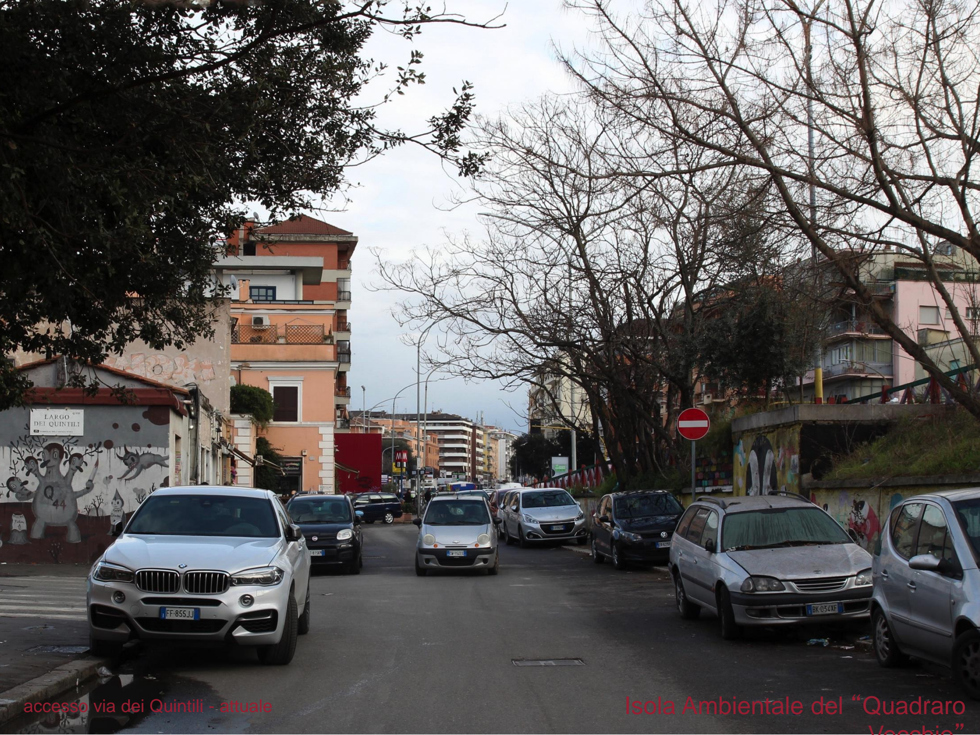
accesso via dei Quintili - attuale