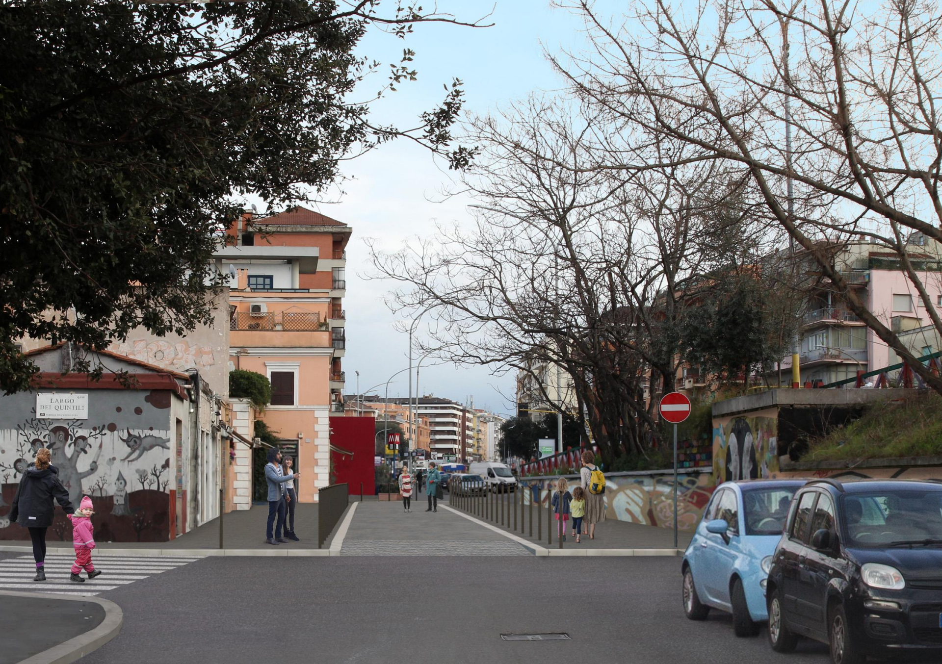
accesso via dei Quintili - progetto