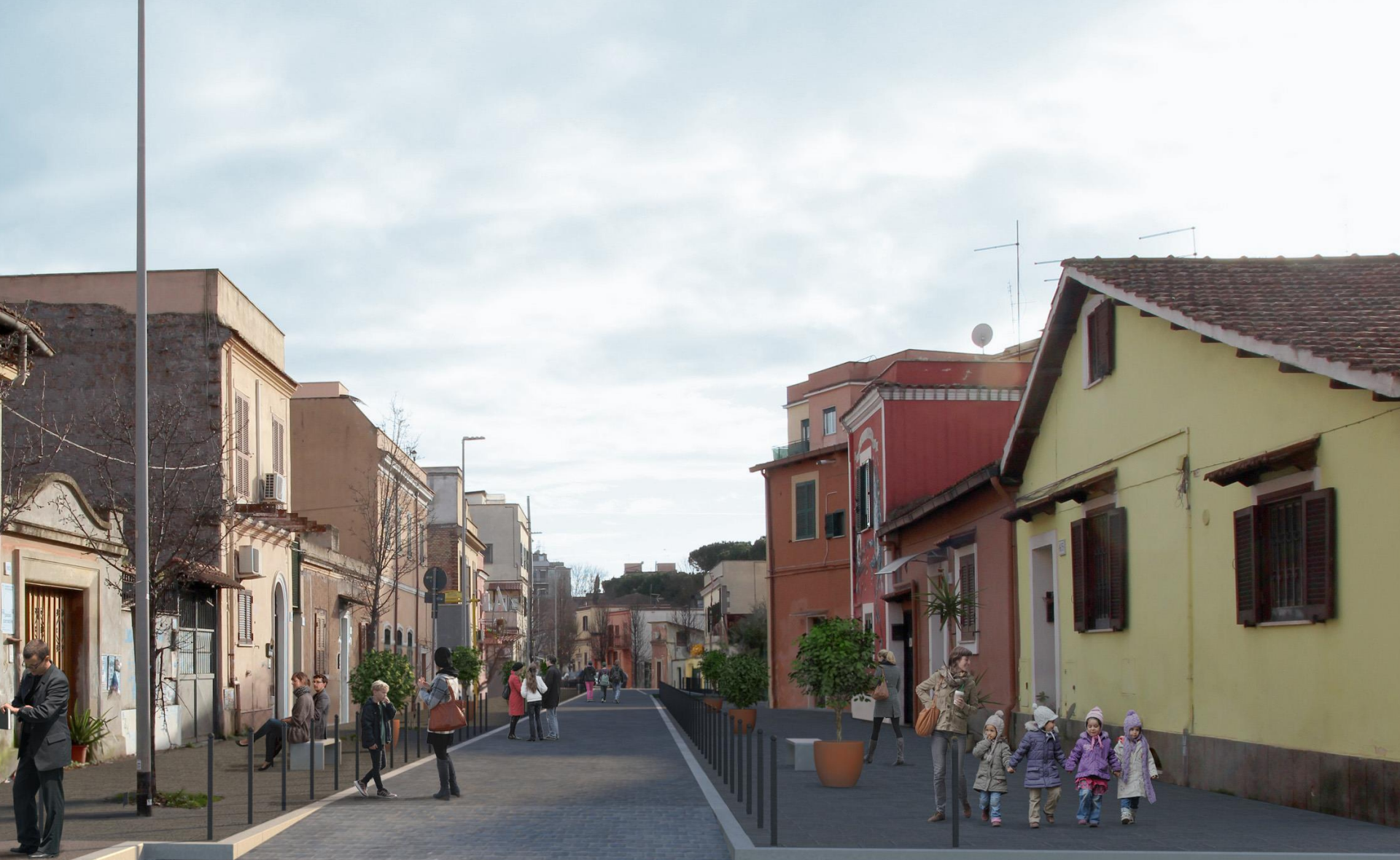
via dei Quintili - progetto