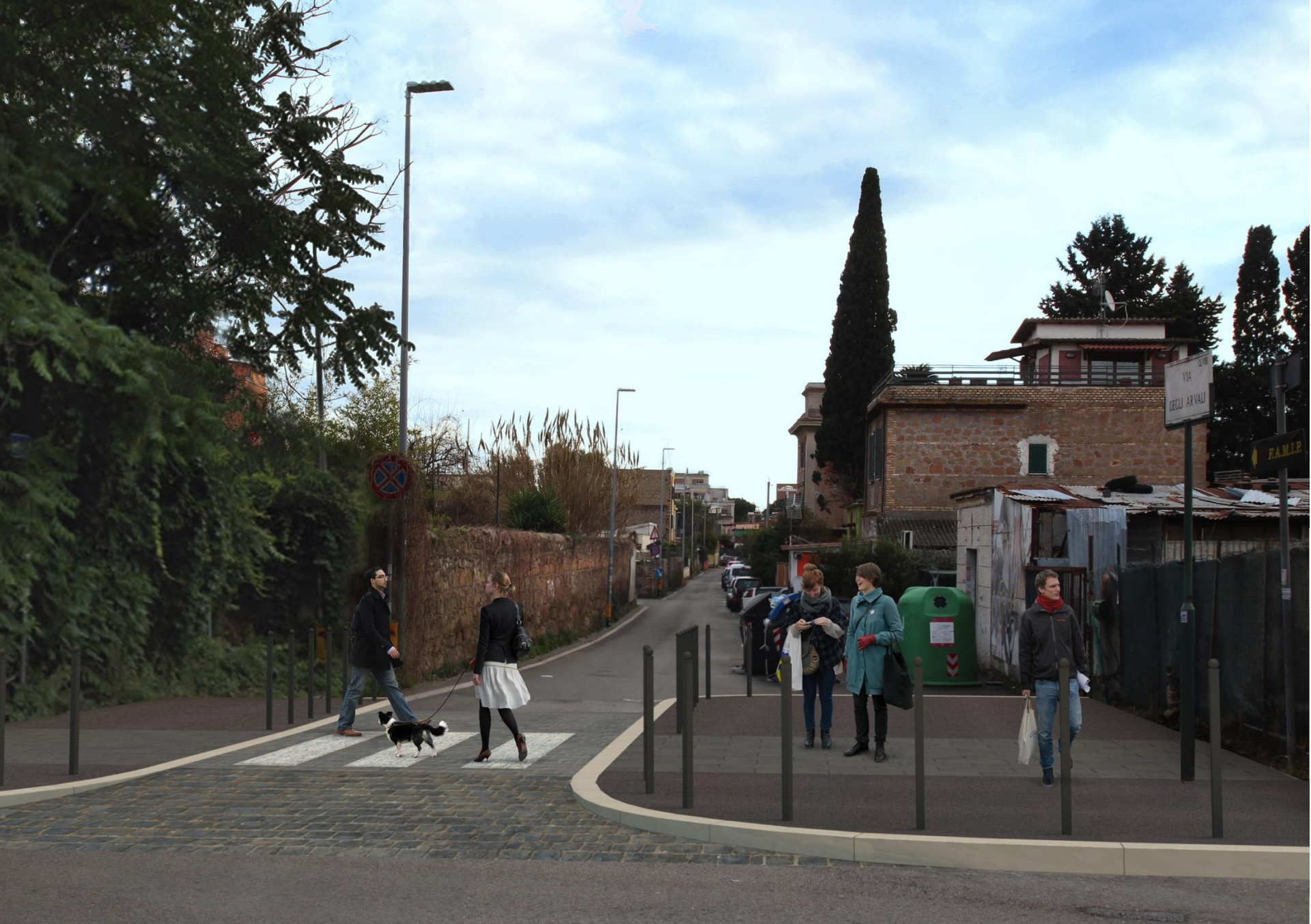
accesso via degli Arvali - progetto