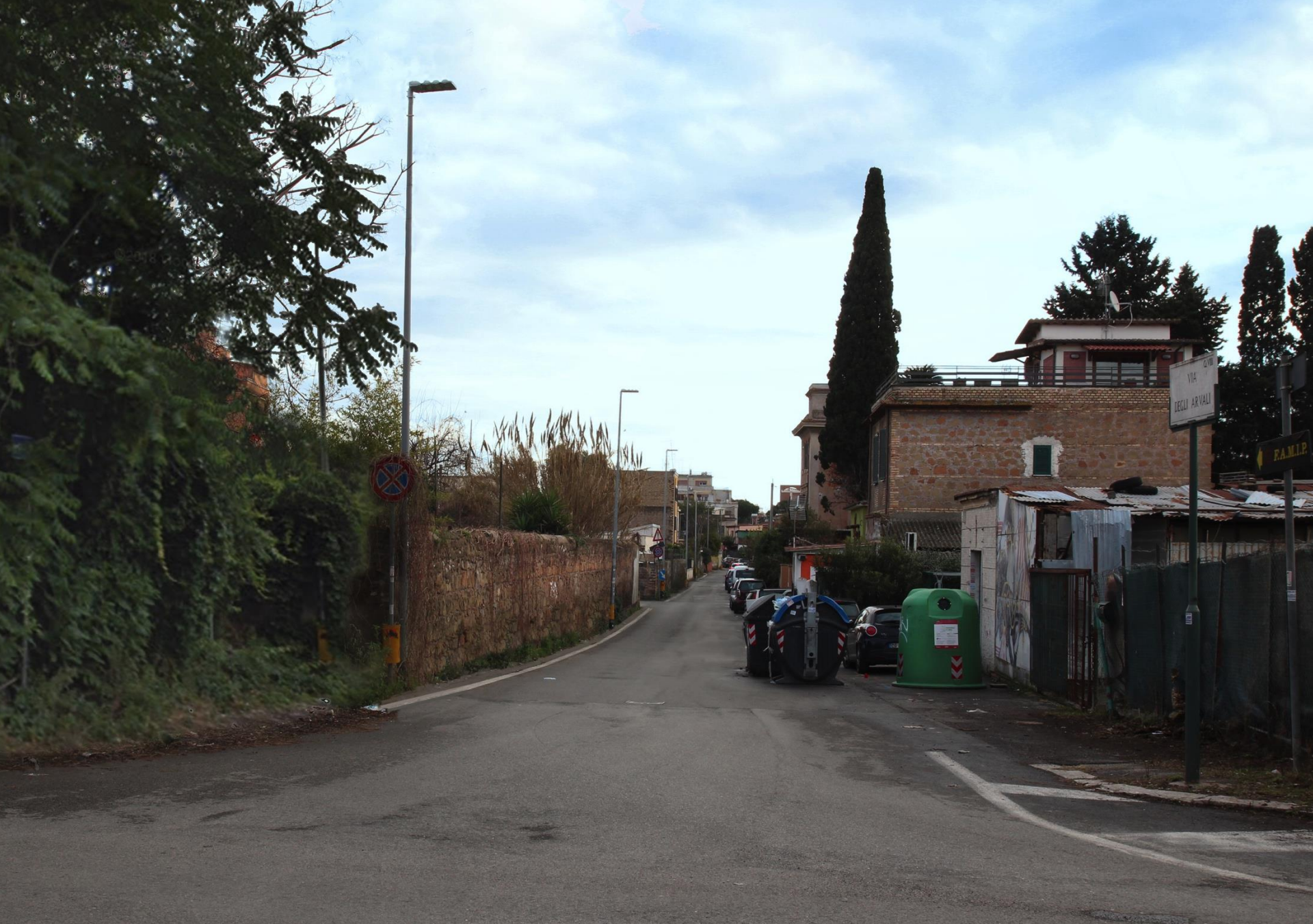
accesso via degli Arvali - attuale